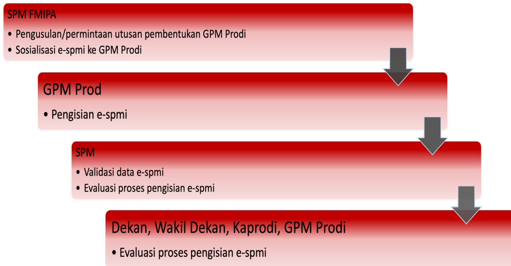
Gambar 1 Mekanisme Pelaksanaan Monitoring