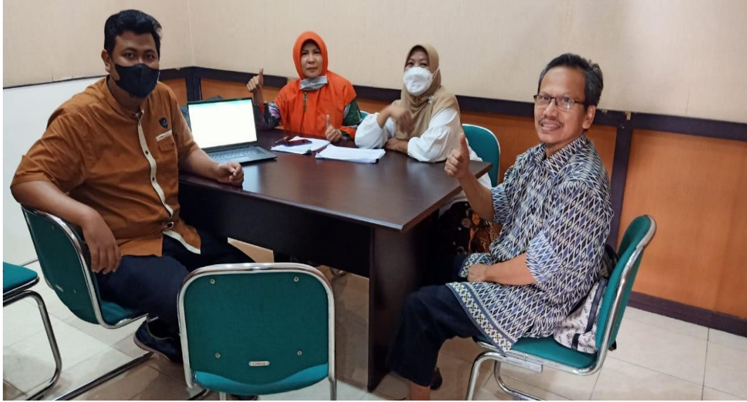
Pelaksanaan Validasi e-SPMI di Sekretariat SPMF FEB Unri