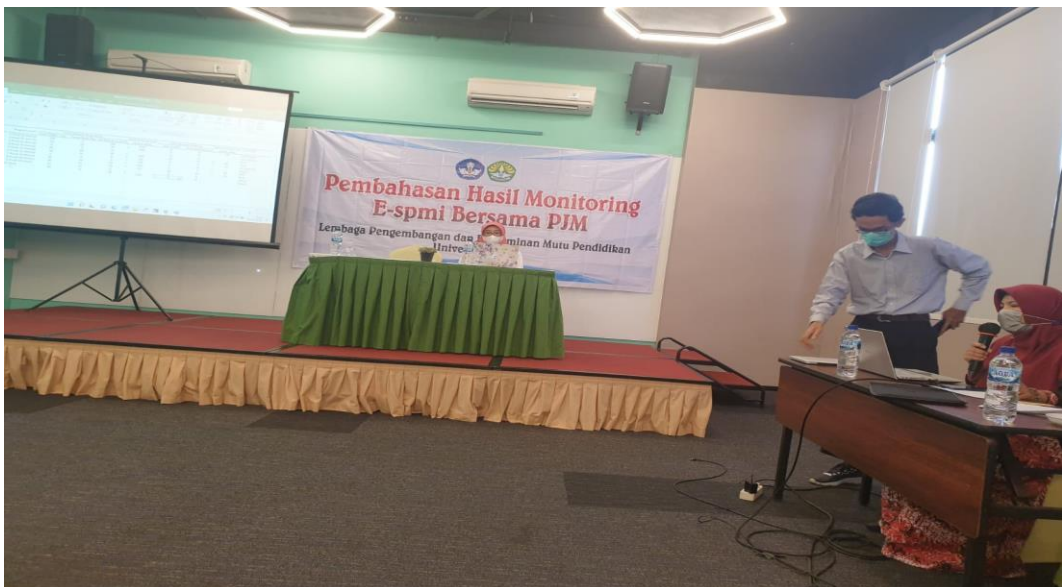
Pembahasan Hasil Monitoring e-SPMI Bersama PJM Universitas Riau Senin, 6 Juni 2022 di Hotel The Zuri Pekanbaru